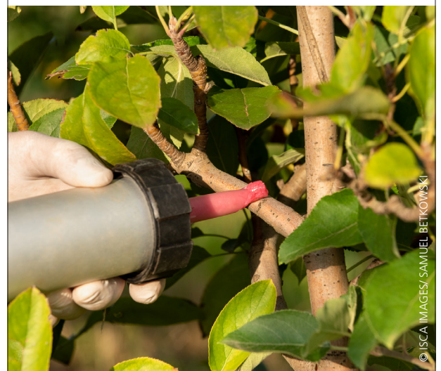
COMO APLICAR APIS BLOOM EN MANZANO