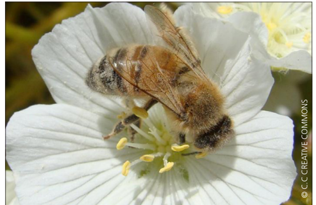
LA ABEJA APIS MELLIFERA POLINIZA UNA FLOR DE MANZANO